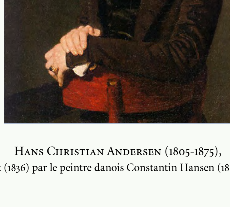
HANS CHRISTIAN ANDERSEN (1805-1875), portrait (1836) par le peintre danois Constantin Hansen (1804-1880).

Les contes d'Andersen paraissent dans la collection « Rêver en diable »