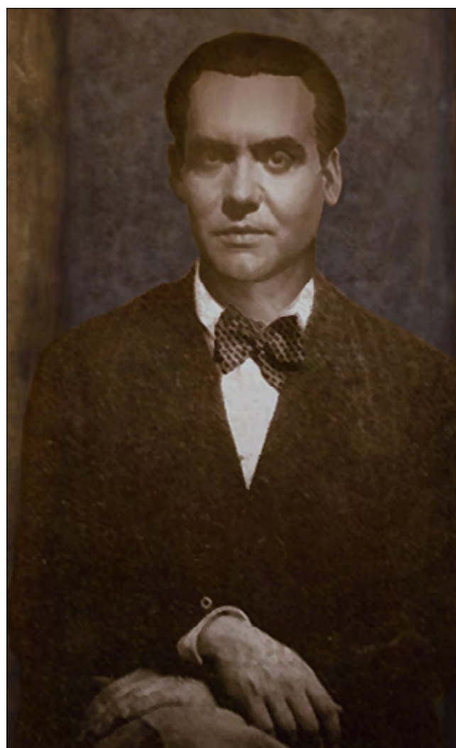
FEDERICO GARCIA LORCA (1898-1936).