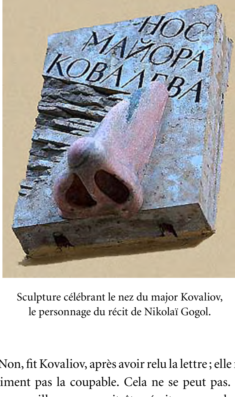
Sculpture célébrant le nez du major Kovaliov, le personnage du récit de Nikolai Gogol.

— Non, fit Kovaliov, après avoir relu la lettre ; elle n'est vraiment pas la coupable. Cela ne se peut pas. Une lettre pareille ne pourrait être écrite par quelqu'un qui aurait commis un crime.